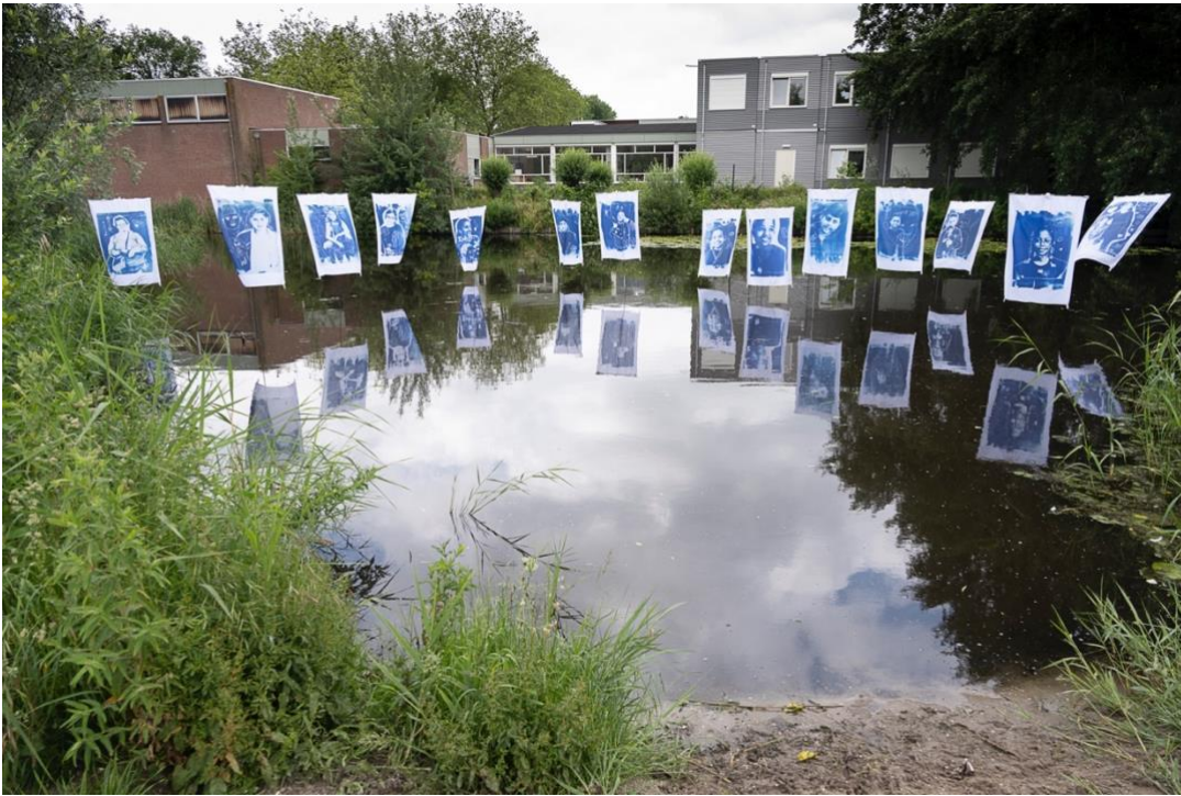
Blauwdrukken van de kinderen uit Molenwijk te zien tijdens de Kunstroute 'het Ongeziene Gezien' 2021