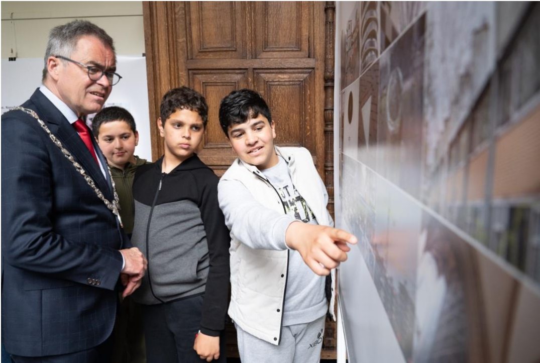
'Meet en Greet' met de makers van DubbelBelicht als Brug over het Spaarne'