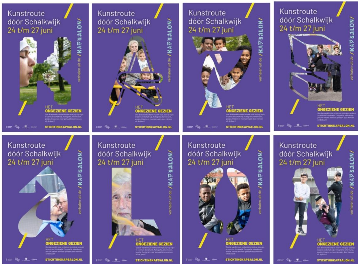
Mupi's te zien door de stad tijdens de kunstroute 2021