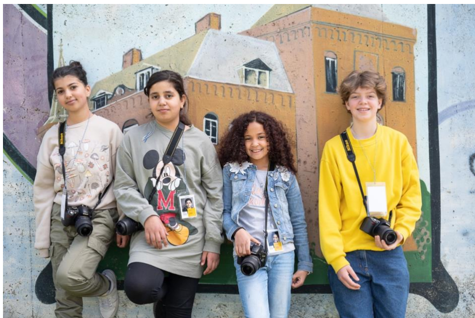
Het team van Kinderpersbureau 1, georganiseerd vanuit de Bibliotheek Schalkwijk ism Hart mei 2022

1 Kinderpersbureau Partners: Hart en Jong023. Locaties: Bibliotheek Schalkwijk, Speeltuyn Delftwijk.